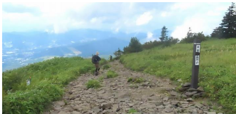
牧場、目掛けて下山開始