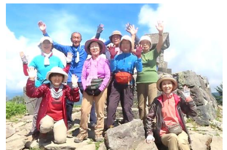
熟女・淑女の集団2班の皆さん