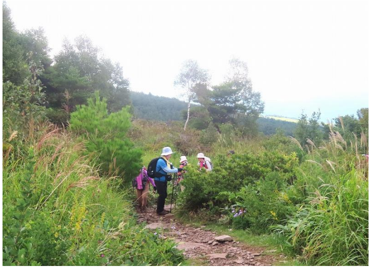
樹林帯を抜け頂上まで、もうちょっと