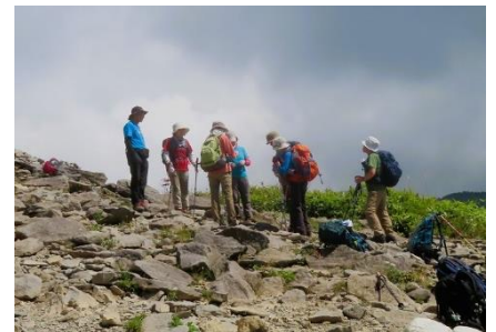
頂上に トウチャコ