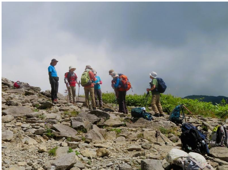
頂上に トウチャコ