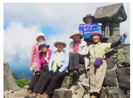
人の鏡となりうる3班の皆さん