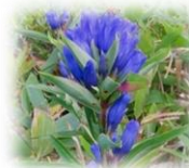
オヤマノリンドウ