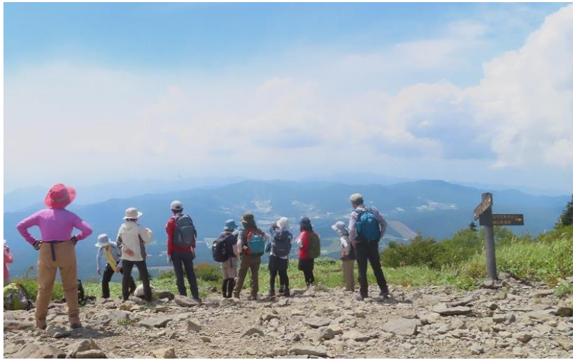
山頂に到着 北アルプスは雲の中