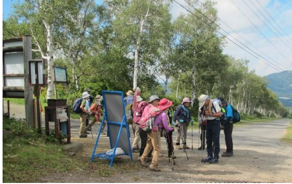
3班ミーティング（各班5分間隔で出発）