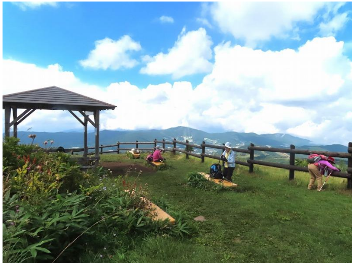
東屋で花々に囲まれて。アルプスは残念ながら見えません。