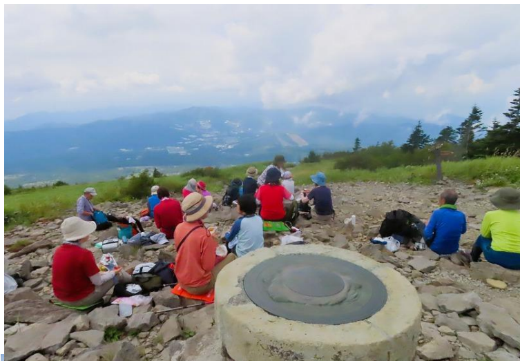
山頂で楽しい昼食の時間