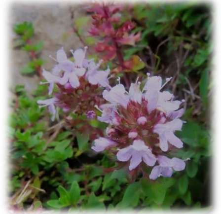
イブキジャコウソウ