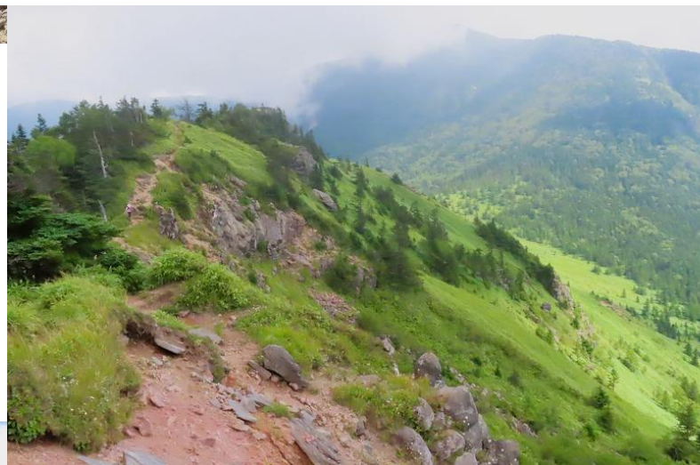
山頂から百名山の四阿山を望む