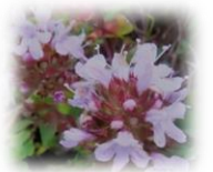
イブキジャコウソウ