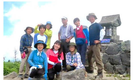
青春を再謳歌している1班の皆さん