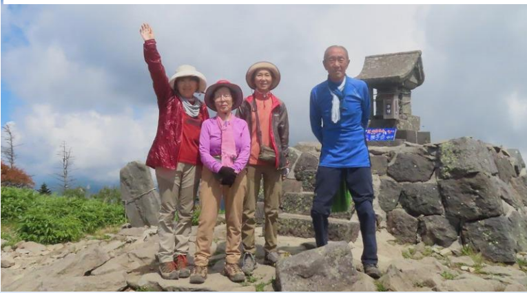
私達は、頑張って登りました。