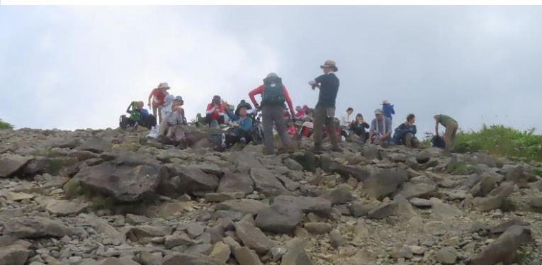
名残惜しいですが下山体制。