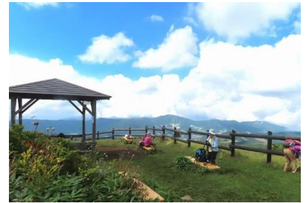
東屋で花々に囲まれて。アルプスは残念